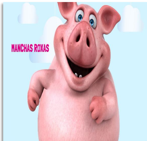
Video da Campanha

https://www.youtube.com/watch?v=sfuOcDctRBQ